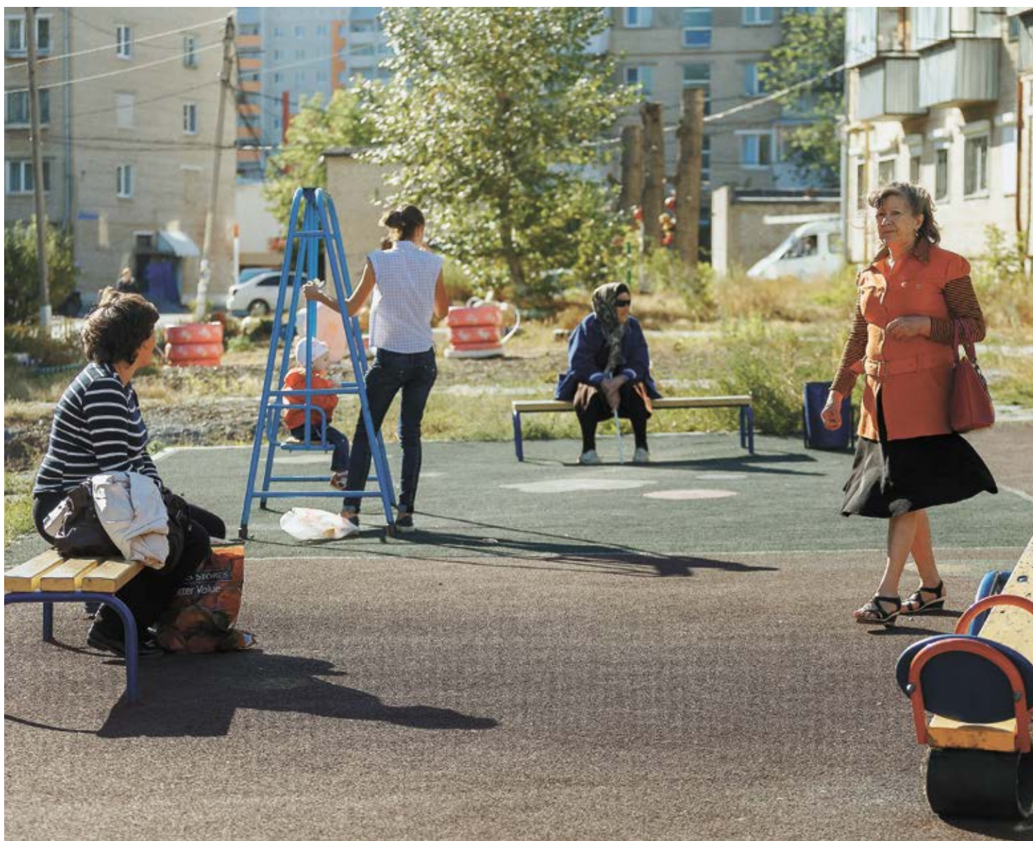
➤ Фото: Павел Кулешов